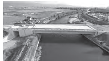
橋長●44.00m 支間長●42.60m 桁長●43.80m