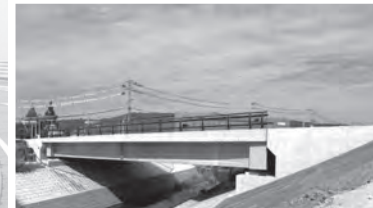
橋長●29.50m 支間長●28.10m 桁長●29.40m