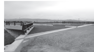
橋長●13.50m 支間長●12.94m 桁長●13.44m