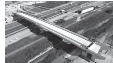
橋長●136.00m 支間長●64.40m・68.40m 桁長●134.50m